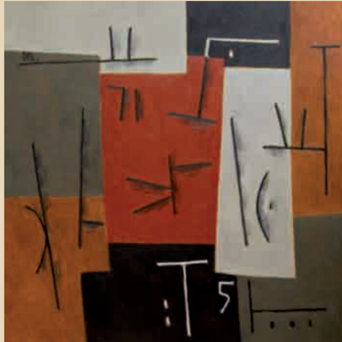
5, el fruto Óleo sobre tela, 90 x 90 cm, 2004