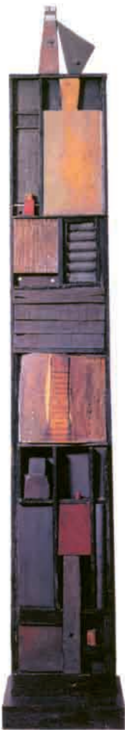
Tótem, madera, 1941