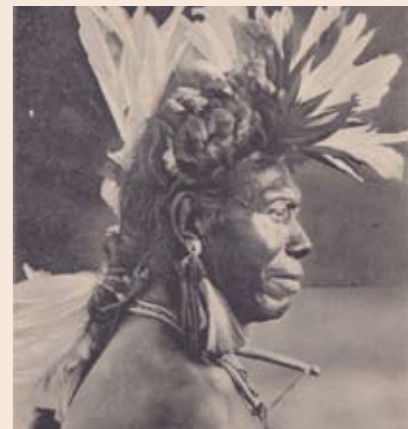
Indio Chamacoco, «Apuléi Préta», Puerto 14 de Mayo. Colección Boggiani, publ. por Dr. R. Lehmann Nitsche, N° 47 2047 Editor R. Rosauer, Rivadavia 571, Buenos Aires.

A principios del siglo XX, grandes centros de investigación se interesan en el Chaco, región que continúa atrayendo a los europeos. No todos emplean por igual la cámara fotográfica como herramienta de tra-